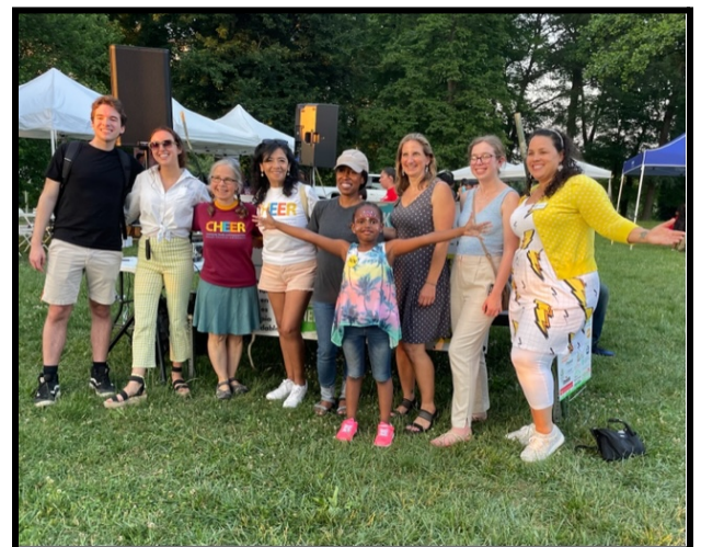
Personal y socios de CHEER en Power in the Park

El 1 de junio, CHEER colaboró con la delegada del estado de Maryland, Lorig Charkoudian, para organizar el tercer evento anual Power in the Park en New Hampshire Estates Neighborhood Park en Long Branch. Las actividades incluyeron una mesa para niños, información sobre salud y bienestar, y una variedad de recursos comunitarios destinados a conectar a las familias con programas de ahorro de energía. Veinte jóvenes de LBCAY fueron reclutados como embajadores del evento, ayudando con la traducción al español y otros, organizando una mesa CHEER con actividades para niños. A través de esta oportunidad de servicio, uno de los jóvenes voluntarios también se conectó con el Hospital Holy Cross y logró una pasantía de verano. Aproximadamente 300 miembros de la comunidad asistieron al evento.