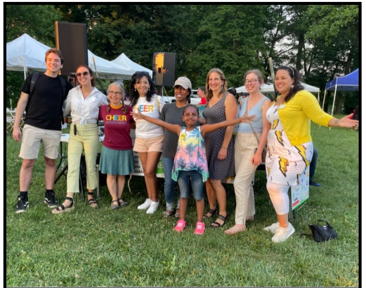
CHEER Staff & Partners at Power in the Park June 2023

Twenty LBCAY youth volunteered at the event assisting with Spanish translation and hosting a CHEER table offering activities for children. Through this service opportunity, one of the youth volunteers also connected with Holy Cross Hospital leading to a summer internship. An estimated 300 community members attended the event.